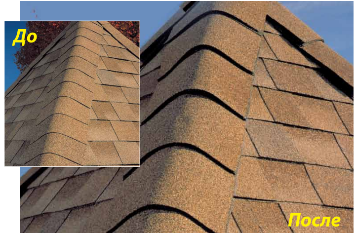
До: Коньки с обрезанной черепицей трехпестковой вместо Timbertex®